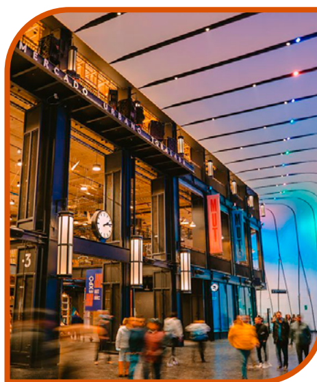
Mercado Urbano Tobaraba (MUT)