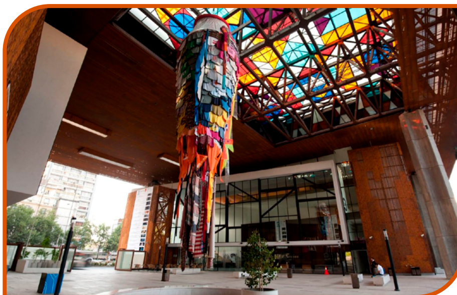
Teleférico cerro San Cristóbal - Parque MET