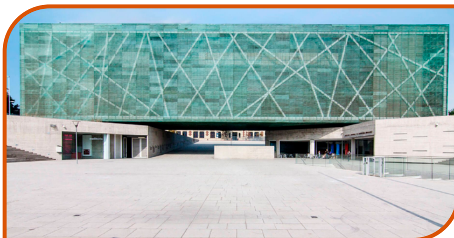
Museo de la Memoria y los DDHH