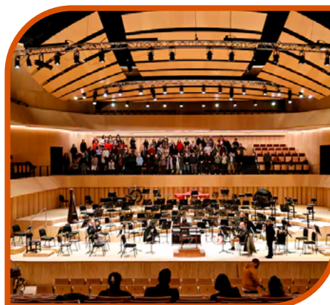
Orquesta Sinfónica Nacional de Chile - CEAC