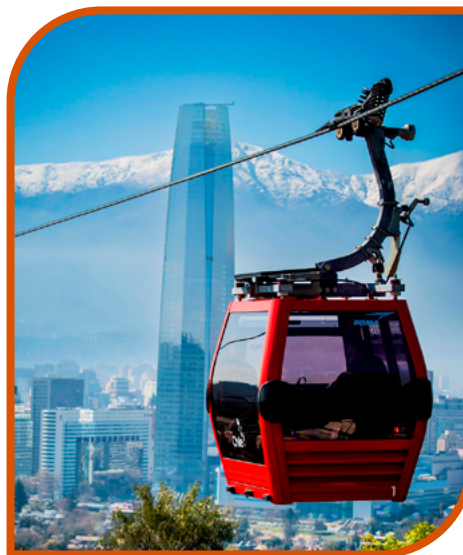
Teleférico cerro San Cristóbal - Parque MET